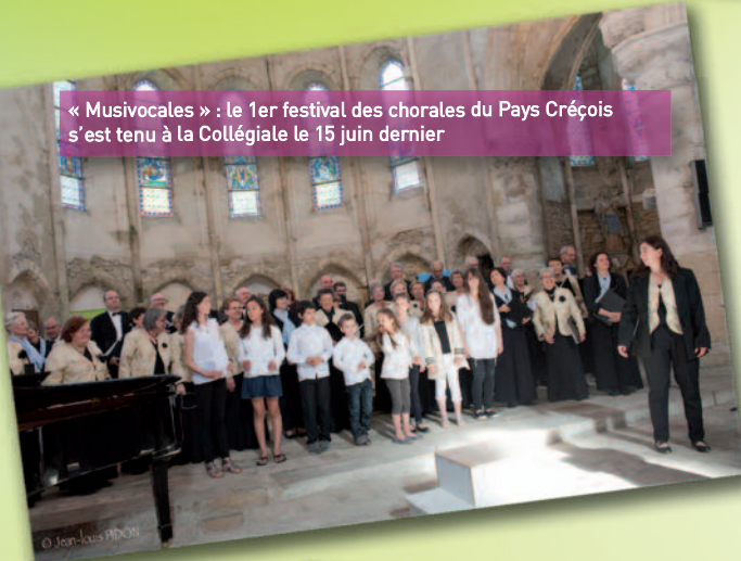
« Musivocales » : le 1 er festival des chorales du Pays Créçois s'est tenu à la Collégiale le 15 juin dernier