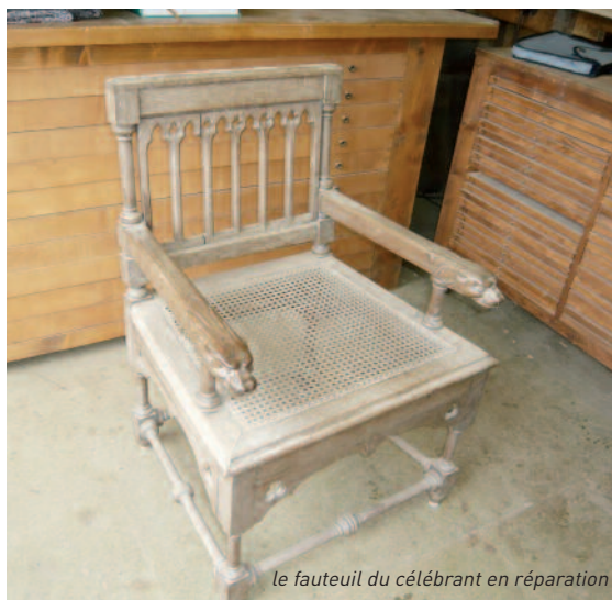
le fauteuil du célébrant en réparation