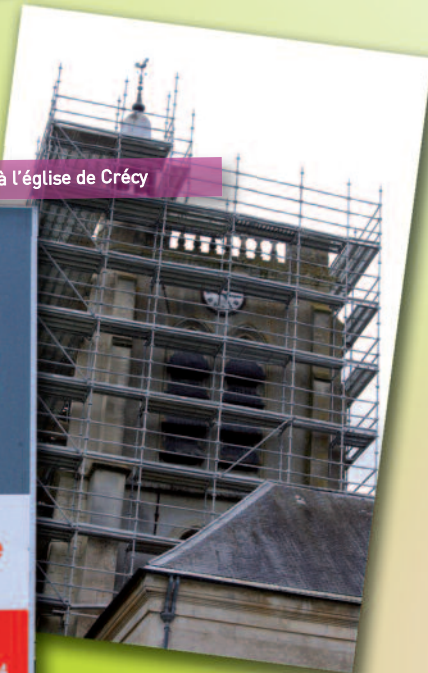
Début des travaux à l'église de Crécy