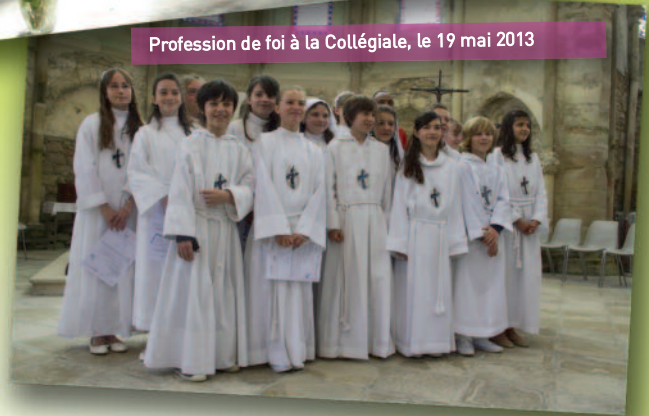
Profession de foi à la Collégiale, le 19 mai 2013