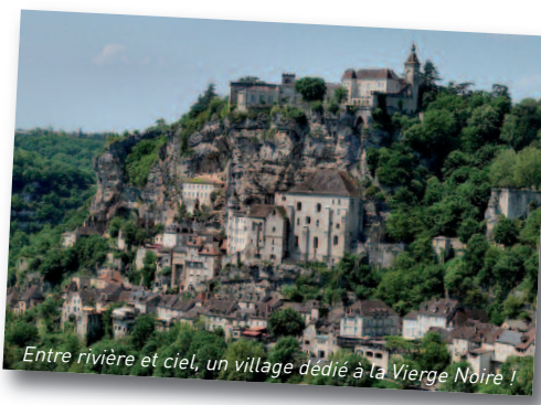
Entre rivière et ciel, un village dédié à la Vierge Noire !

s'assombrir au cours des siècles. Par ailleurs elle fut pendant longtemps dans une grotte, puis une toute petite chapelle où les pèlerins venaient faire brûler des cierges : la fumée et la suie, à la longue, l'ont noircie. Egalement la statue était pendant longtemps recouverte de plaques d'argent pour la mettre en valeur : mais ce métal précieux noircit aussi en s'oxydant. Voilà pourquoi Notre Sainte Dame est noire. Croyant ou non croyant, la visite de ce lieu est un grand moment.